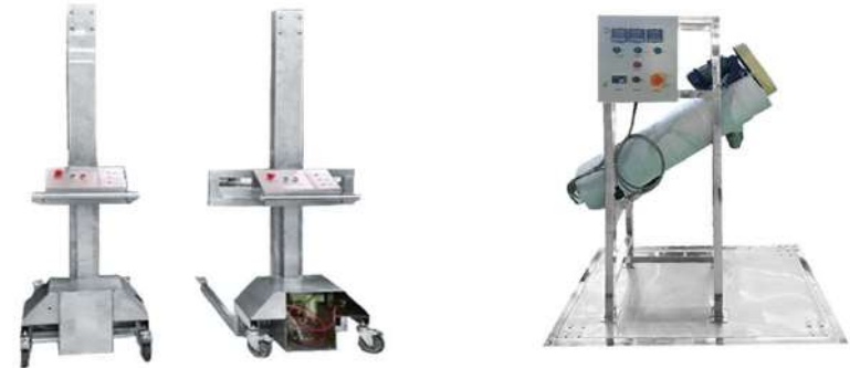
電動リフトと自動カイコ トレイ回収機