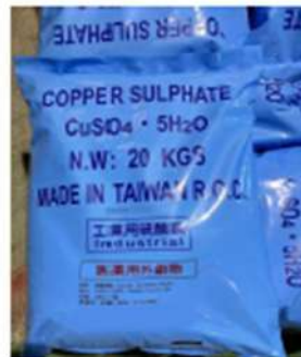
20KG PE袋 表